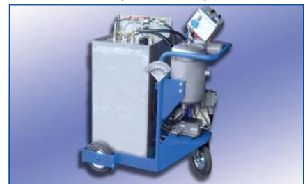
Nebenstromfilter mit Tank